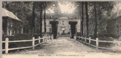
Le château, inscrit à l'inventaire des monuments historiques depuis 2002, est une propriété privée, dans la même famille depuis 1805. Il ne se visite pas.

Les dépendances sont remaniées au XIX e siècle à la suite d'un incendie. La ferme sera en activité jusqu'en 1996.